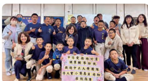
1141120 中信愛接棒課輔訪視