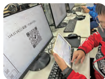
1141114 客語認證班持續進行中