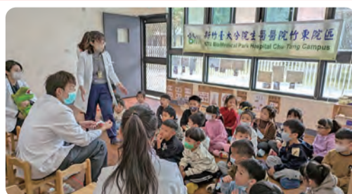
1141204 附幼口腔衛生保健宣導