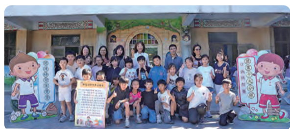
1141107 圖書十大分類快閃