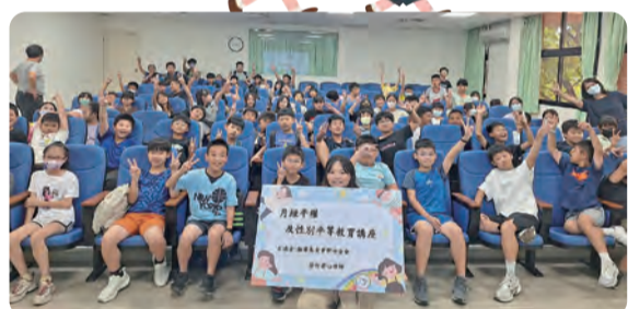
1141016 月經平權與性別平等講座