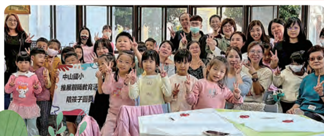
1141129 親職教育·陪孩子圓夢